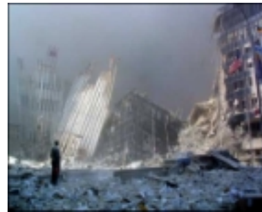
Figure 9. « flag2.jpg » (sans date ni signature). Photographie en couleurs représentant les ruines du World Trade Center, d'où émergent la silhouette d'un homme et, dans le bord droit de l'image, un drapeau américain. (Des images similaires prises par des professionnels ont été largement diffusées ; celle-ci était annoncée « originale ». Titre du e-mail : « The flag was still there ». Date : 13/09/01. Contenu du e-mail : « A very good image to pass around. » Collection personnelle.)