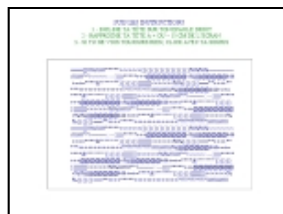
Figure 16. « illusion_d'optique.pps », planche 2 (sans date, ni signature). La deuxième planche renforce l'illusion, avec des consignes supplémentaires et le maintien de l'illustration.