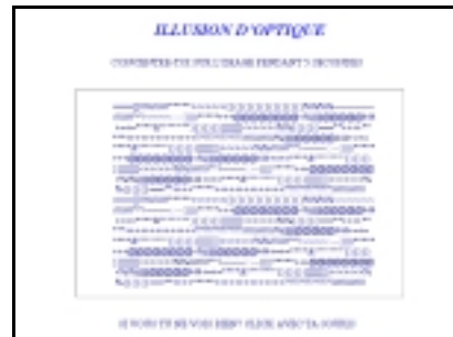
Figure 15. « illusion_d'optique.pps », planche 1 (sans date, ni signature). Diaporama humoristique en couleurs : la première planche donne l'illusion d'entrer dans un test de psychologie populaire, type QI, avec des consignes et une illustration.

images rumorales semble confortée par le nombre croissant de « diaporamas » dans le corpus d'images rumorales. Conçus à l'aide de logiciels prévus à l'origine pour réaliser des présentations audiovisuelles en public, les