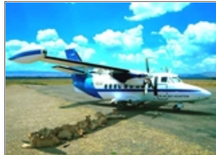
Figure 8. « AFRICA.jpg » (sans date ni signature). Photographie en couleurs représentant un avion de tourisme garé en bout de piste, dans l'ombre duquel sont alignés paisiblement neuf lionnes et lionceaux. (Titre du e-mail : « une petite pour la route ». Date : 03/09/2001.)

Ce cliché est l'objet de discussions ardentes, mêlant moult arguments de sens commun (pas le bon accoutrement pour un jour ensoleillé de septembre), pratiques (une seule tour du World Trade Center possédait un observatoire ouvert au public, et ce n'est pas celle qui est attaquée par le Nord) ou technique (bruit des réacteurs qui aurait dû détourner l'attention des protagonistes de la scène). À la fin de l'argumentaire, on attache volontiers le