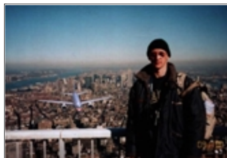
Figure 10. « crash.jpg » (daté, non signé). Photographie en couleurs représentant un touriste à la balustrade d'un gratte-ciel américain, et un avion en arrière-plan fonçant sur la scène. (Le cliché porte la date "automatique" du 11 septembre 2001 : « 09 11 01 », en bas à droite. La date est maquillée, de l'aveu de l'auteur.)