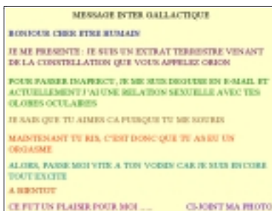
Figure 6. « message_interplanetaire.pps », planche 1 (sans date, ni signature). Diaporama en deux planches. La première reproduit avec une typographie colorée le discours imaginaire d'un extra-terrestre se déguisant en e-mail...