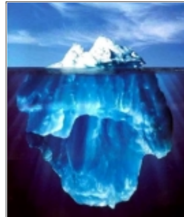
Figure 2. « Iceberg.jpg » (sans date, ni signature). Montage photographique (couleurs) représentant un iceberg immergé dans une mer limpide, sous un ciel bleu azur. (Les sites bien informés permettent de retrouver l'auteur, Ralph A. Clevenger, et diffuseur, l'agence américaine Corbis.)

Nonobstant les réserves théoriques, i. e. que les images rumorales soient le résultat d'un effet de réel ou des objets réels, elles se constituent donc au gré des recherches qui leur sont consacrées, faisant apparaître un réel corpus de récits rumorales... sans aucune garantie ce dernier représente une quelconque catégorie positive.