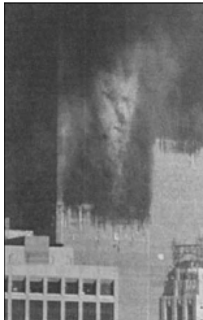
Figure 1. « face_ap.jpg » (sans date, ni signature). Photographie en noir & blanc prise par un photographe indépendant, sur support numérique, le jour de la catastrophe du World Trade Center.

La caractéristique principale des images rumorales, tout comme les rumeurs "langagières", est cependant paradoxale : c'est l'absence totale de marqueurs pour les identifier. Alors que les contes sont souvent identifiés par le traditionnel « il était une fois », les rumeurs cherchent encore leur marqueur consacré. Pour les "rumeurs langagières", on fait parfois référence à l'emploi du conditionnel 3 ou à la locution « il paraît » 4 ; dans les deux cas pourtant, les emplois sont trop nombreux qui ne concernent pas les rumeurs pour qu'on puisse les caractériser par ce seul point. De même, les images rumorales échappent à la présence de marqueurs formels : rien dans leur constitution ne peut les rattacher à un corpus ou un autre ; ni leur ton, ni leurs thèmes, ni leur technique... A posteriori même, quand on a mené l'enquête pour tenter de leur trouver une origine, une généalogie ou un auteur, la taxinomie est encore trop difficile à dresser. Certes, les thèmes humoristiques semblent