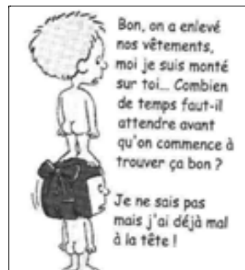
Figure 3. « AMOUR.jpg » (sans date, ni signature). Dessin humoristique au trait (noir & blanc), représentant deux enfants en train de "faire l'amour"...