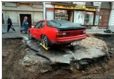
Figure 5. « ouf.jpg » (sans date, ni signature). Photographie insolite (couleurs) d'une voiture immobilisée par un sabot, que les bulldozers ont contourné au cours de leur travail (d'où le titre de la photographie, exprimant le soulagement).

Les exemples d'images rumorales sont souvent tirés de l'immense réservoir que représente le réseau Internet 10 . Il faut l'avouer, le Réseau mondial donne un sérieux coup de pouce à ce type de messages iconiques : ils y circulent comme jamais, y sont aisément conservés, et facilement copiés... Encore faut-il