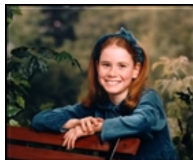
Figure 13. « Penny.jpg » (sans date ni signature). Photographie en couleurs représentant une jeune fille accoudée à un banc public. Sourire aussi franc que convenu, l'innocence semble là encore personnifiée.