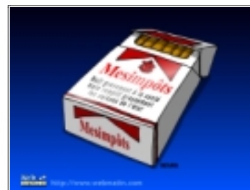
Figure 4. « Mesimpôts.jpg » (non daté, signé). Dessin humoristique au trait (couleurs), représentant un paquet de cigarettes d'une marque connue, dont le nom a été changé pour « Mes impôts », en référence au montant des taxes prélevées sur le tabac. (Signé « Delucq ».