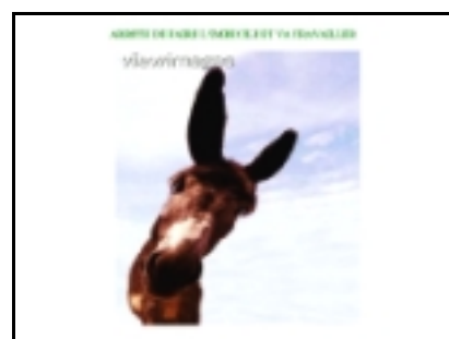
Figure 17. « illusion_d'optique.pps », planche 3 (non daté, non signé, sauf le cliché 1 ). La troisième planche propose une photographie qui éloigne définitivement l'illusion : un âne est représenté dans la position demandée par les consignes précédentes. Un slogan rageur est affiché : « Arrête de faire l'imbécile et va travailler »