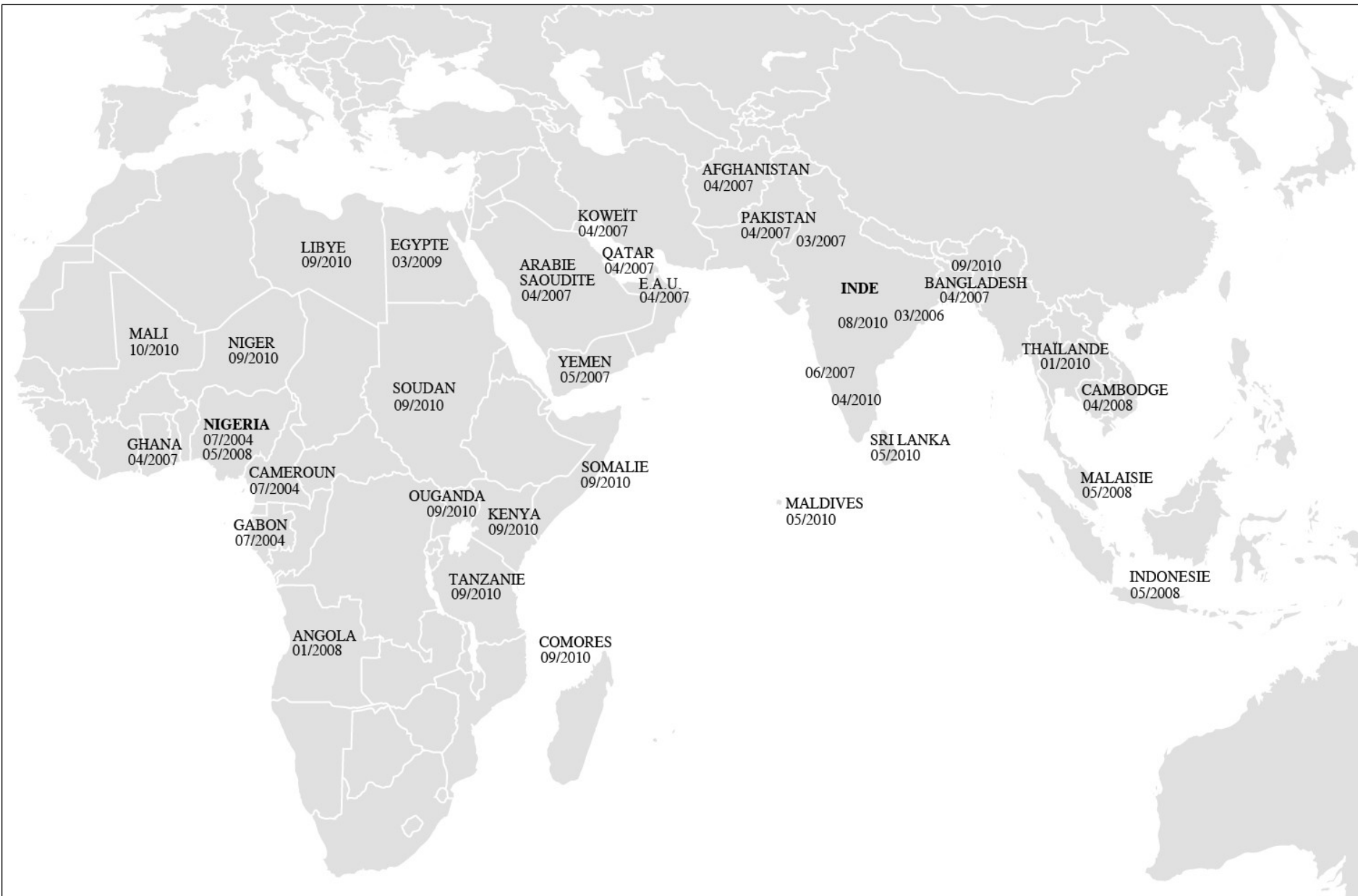
Carte 1. Diffusion de la rumeur des numéros tueurs (2004-2010)